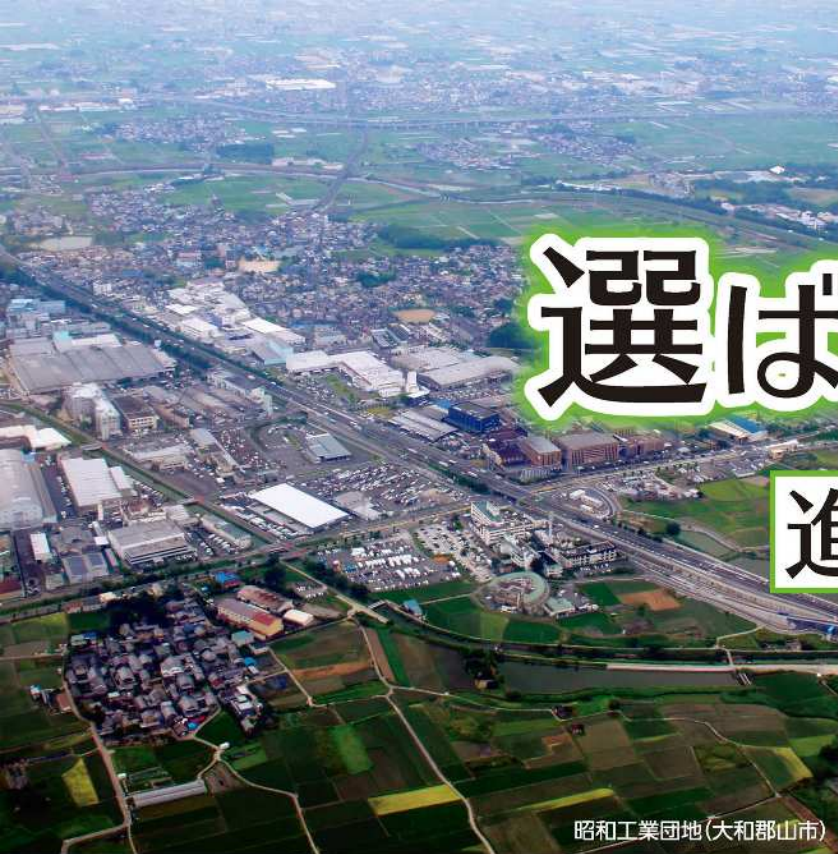
昭和工業団地(大和郡山市)