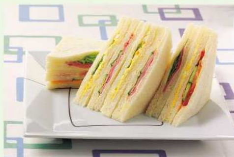
サンドイッチなどの製品は山崎製パンの上質なパンを使い、最先端の技術で製造しています。

現在は一日に3万5千食ほど製造していますが、今後さらに県内の方を積極的に採用し、もっと事業を拡大したいと考えています。