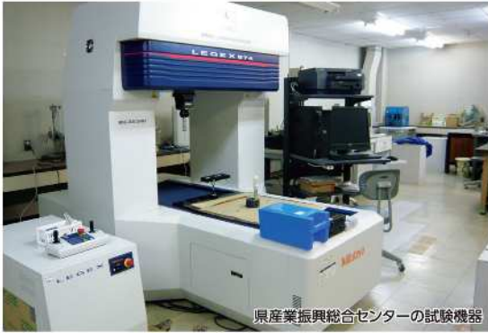
県産業振興総合センターの試験機器

県では、ものづくり企業の製品開発や品質向上の支援を県産業振興総合センターなどで行っています。